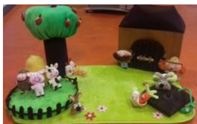
Un des tapis à raconter utilisé lors des rencontres