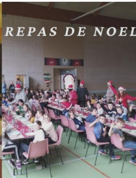
REPAS DE NOEL