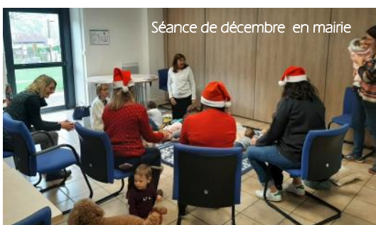
Séance de décembre en mairie

Mercredi 21 février - Heure du conte 10h30 à la bibliothèque À partir de 3 ans Réservation indispensable bibliothèque@champagnier.fr